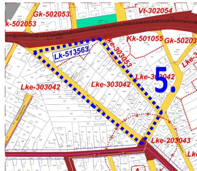
Módosított terv részlete