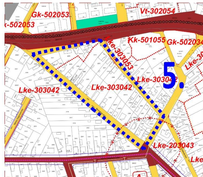
Joghatályos terv részlete